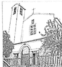
Parrocchia San Giustino