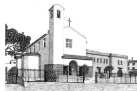
Parrocchia san Giustino viale Alessandrino 144 Roma – 06 39739031

Il Foglio della settimana si può ricevere su email con la newsletter, indirizzando la richiesta a info.sangiustino@libero.it oppure consultando il sito: www.parrocchiasangiustino.it , o www.donpietrobottazzoli.org